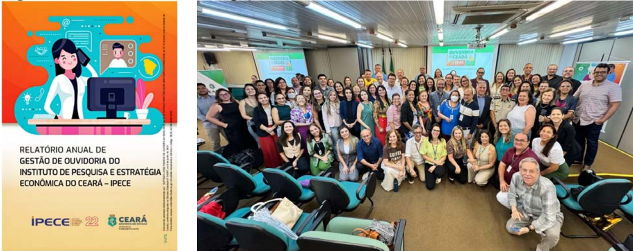
Figura 6 - Banner e Foto de Divulgação