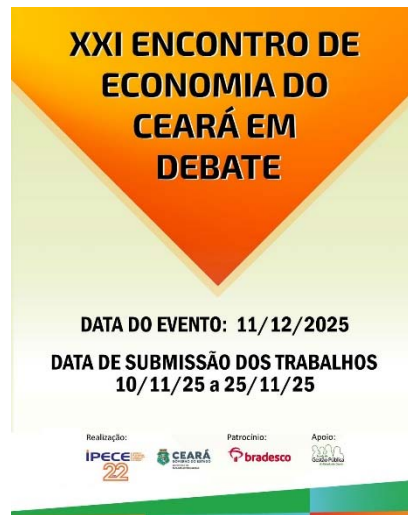
Figura 5 - Banner de divulgação

Comercial E Comércio High-Tech: Impactos No Mercado De Trabalho Cearense. Informações disponíveis no site do Instituto.