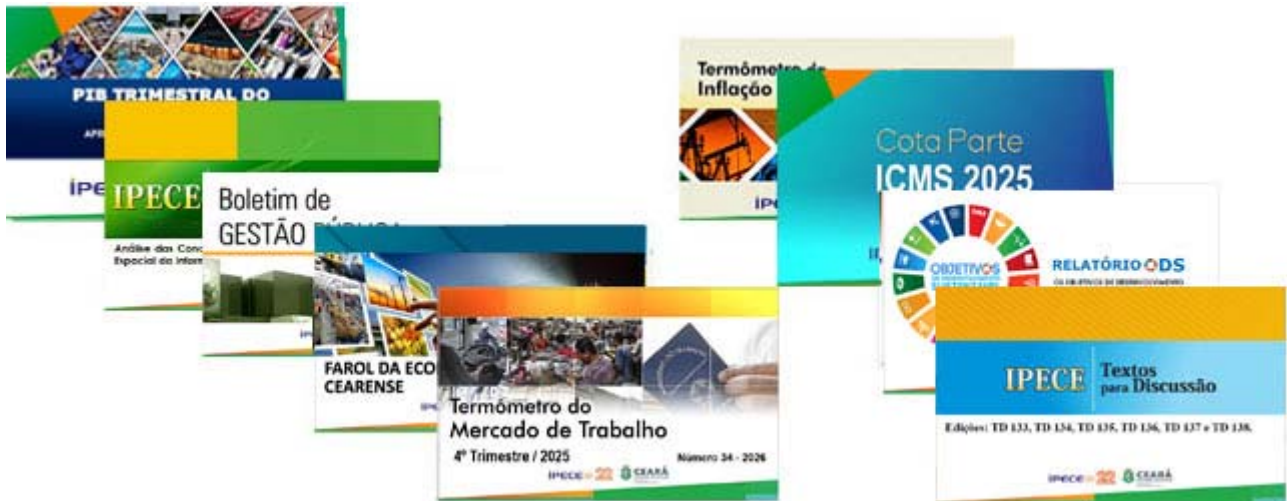
Figura 4 - Principais Publicações do IPECE – 2025

A seguir, destacam-se as publicações que estão disponibilizadas ao público na forma eletrônica no site www.IPECE.ce.gov.br .