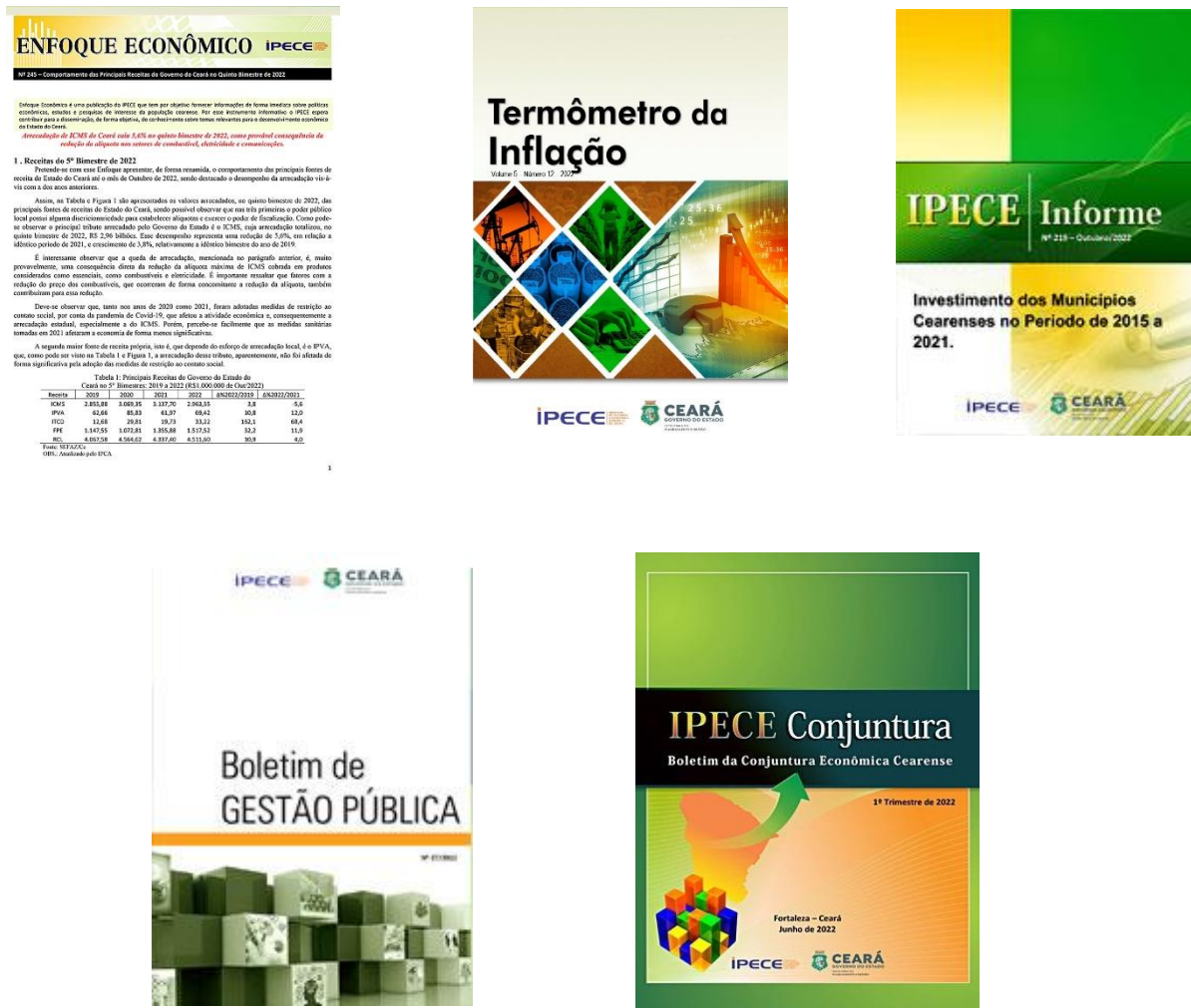
Figura 4 - Exemplos de Publicações do IPECE – 2022

onde destacam-se as seguintes publicações, que estão disponibilizadas ao público na forma eletrônica através do site www.ipece.ce.gov.br .