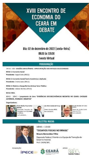
Figura 5 - Banner de divulgação

No evento, que aconteceu no formato on line, participaram 83 (oitenta e três) pessoas. O encontro teve a parceria da Escola de Gestão Pública.