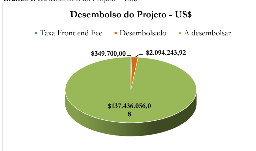
Gráfico 1: Desembolsos do Projeto – US$