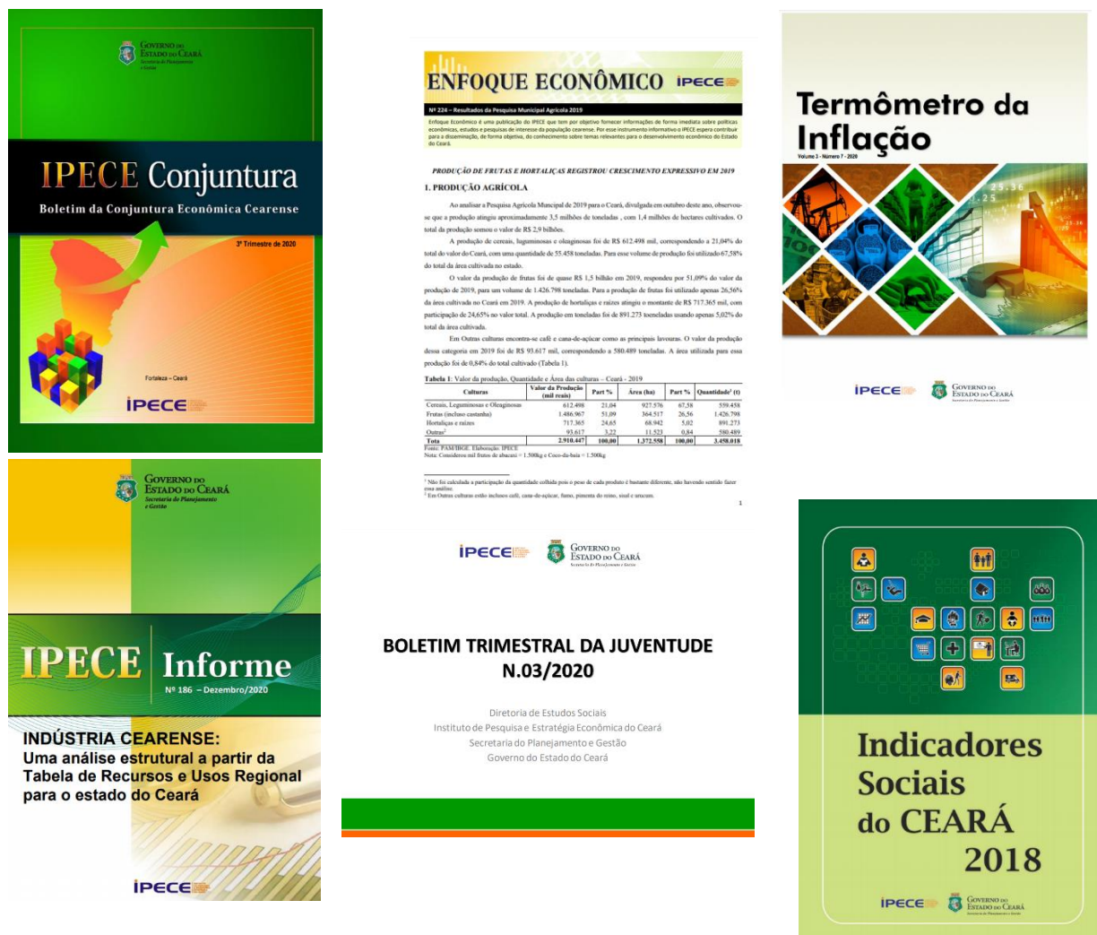
Figura 5 - Exemplos de Publicações do IPECE - 2020

No Resultado Estratégico 1, o Instituto elaborou e disponibilizou informações geosocioeconômicas do Ceará para a sociedade, com uma previsão de 129 (cento e vinte e nove) projetos que gerariam 249 (duzentos e quarenta e nove) produtos para o ano de 2020. Foram realizados os projetos que resultaram em 276 (duzentos e setenta e seis) produtos entregues pelas diretorias e gerência da área finalística do IPECE cumprindo 111% de sua meta (Quadro 18). Consta-se que os produtos gerados com esse objetivo representam mais da metade de todos os produtos disponibilizados pelo IPECE em 2020, onde destacam-se as seguintes publicações, que estão disponibilizadas ao público na forma eletrônica através do site www.ipece.ce.gov.br .