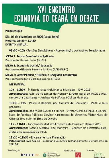
Figura 6 - Banner de divulgação