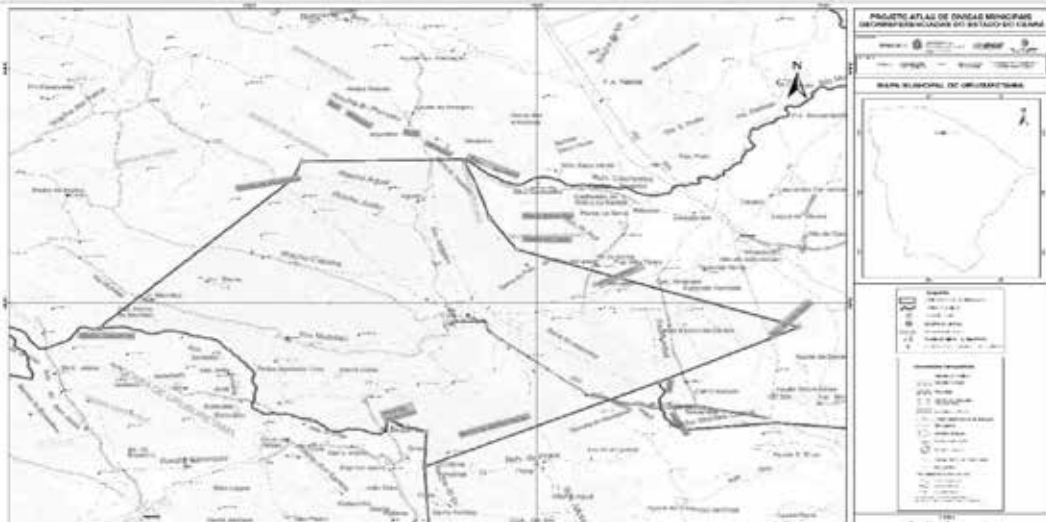
Mapa municipal de Uruburetama, parte integrante desta Lei.

Com o município de ITAPAJÉ - Ao sul e a oeste. Começa no ponto de coordenadas [442.857 / 9.594.410], na serra de Santa Úrsula; segue em linha reta até o pico do Beija-Flor [442.908 / 9.595.640]; segue pelo divisor de águas entre os rios Mundau e Caxitoré até o ponto de coordenadas [433.764 / 9.599.122], no morro Coquinho.