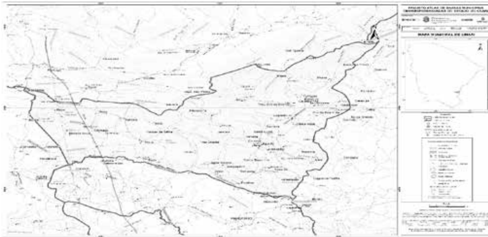
Mapa municipal de Umari, parte integrante desta Lei.

Com o município de LAVRAS DA MANGABEIRA - A oeste. Começa na foz do Riacho Jenipapeiro no Riacho Pendência [517.271 / 9.263.030]; vai em linha reta até o ponto de coordenadas [516.493 / 9.265.258] no Serrote Carnaúba; por outra reta vai até o cruzamento do riacho Urubu com a estrada que liga Bonita a Umarizinho [513.978 / 9.269.162] e segue por esta estrada até seu cruzamento com o riacho do Umarizinho [513.645 / 9.272.499].