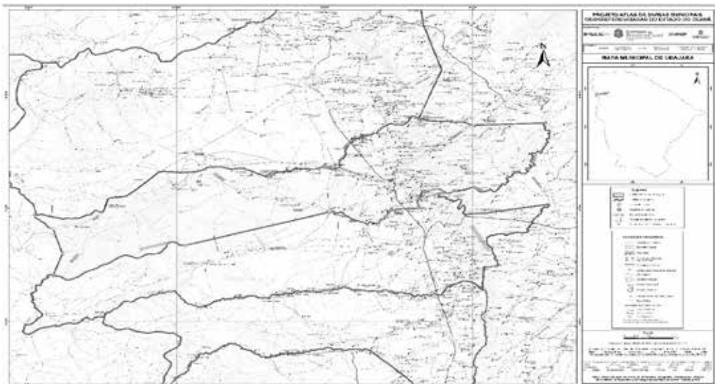
Mapa municipal de Ubajara, parte integrante desta Lei.

Com o estado do PIAUÍ - A oeste. É o limite interestadual no trecho compreendido entre o cruzamento com o rio Jaburu [252.503 / 9.561.065] e o cruzamento com a antiga estrada Fazenda Jardim / Fazenda Queimadas [250.685 / 9.569.096].