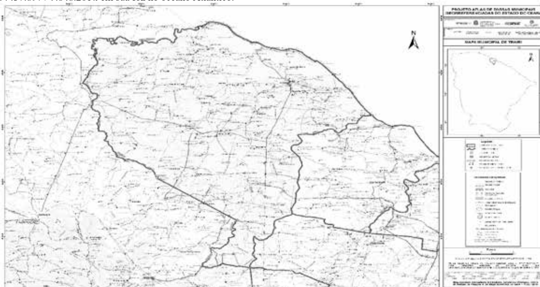
Mapa municipal de Trairi, parte integrante desta Lei.

Com o município de ITAIPOCA - A oeste. Começa na foz do riacho Fundo no rio Mundaú [448.025 / 9.623.982] e desce pelo rio Mundaú até o ponto de coordenadas [457.897 / 9.648.201], em sua foz no oceano Atlântico.