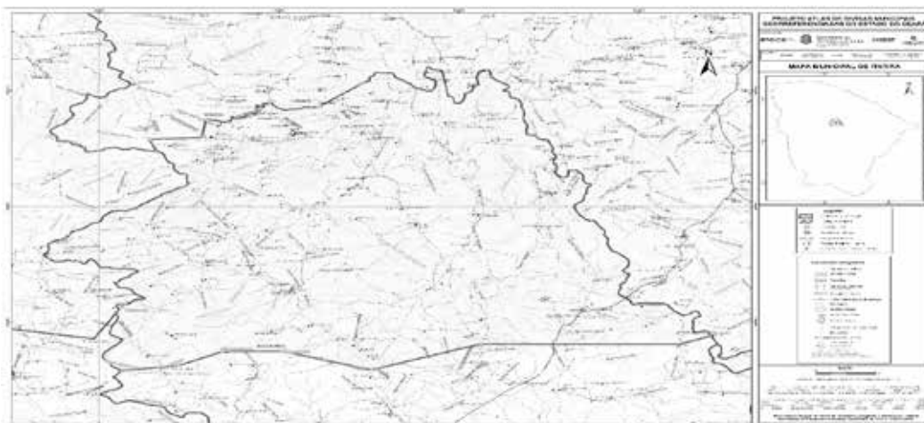
Mapa municipal de Itaitira, parte integrante desta Lei.