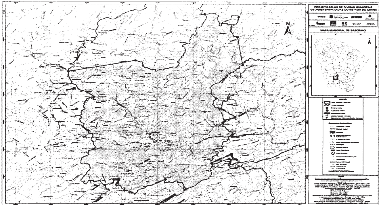
Mapa municipal de Saboeiro, parte integrante desta Lei.

ANEXO CXVIII - A QUE SE REFERE O ART.1º DA LEI Nº16.198, DE 29 DE DEZEMBRO DE 2016