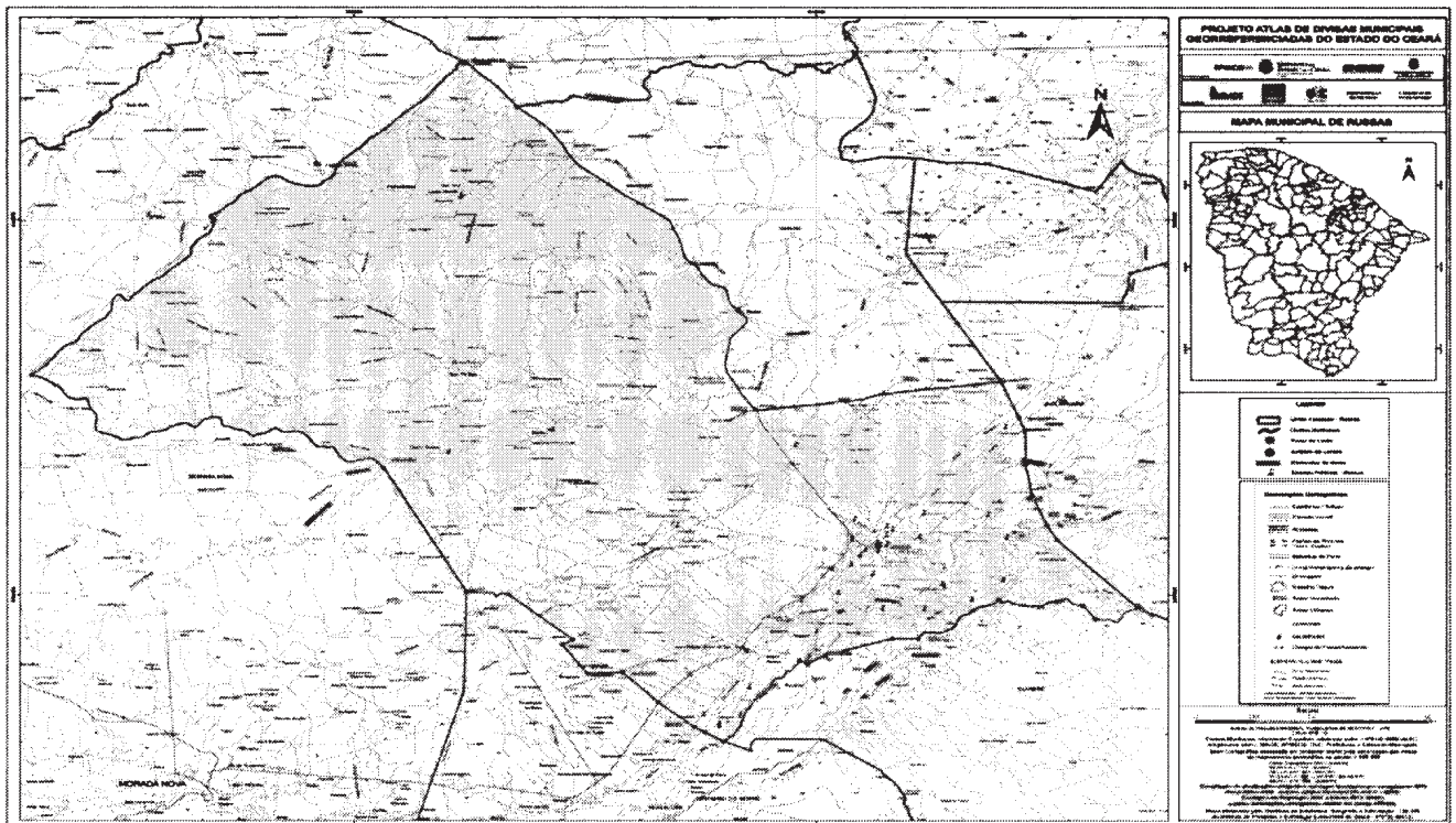
Mapa municipal de Russas, parte integrante desta Lei.

Com o Município de MORADA NOVA - A oeste. Começa no cruzamento da estrada que liga as localidades de Cipó à Vila de Bixopá com o Córrego das Alpercatas [587.291/9.450.254]; segue, em linha reta, até a foz do Riacho da Barbada no Rio Palhano [581.925/9.460.170]; toma o divisor de águas entre o Rio Palhano e seus tributários da margem esquerda que deságuam abaixo dessa foz até o pico do Serrote Verde [559.004/9.467.635] no divisor de águas entre o Rio Palhano e o Riacho Umburanas, a leste, e o Rio Pirangi, a oeste e segue por este divisor até o cruzamento com a Rodovia BR-116 no ponto de coordenadas [587.151/9.492.629].