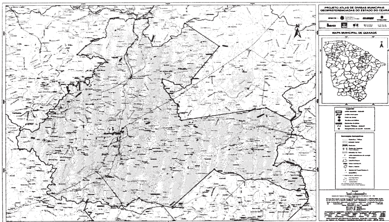
Mapa municipal de Quixadá, parte integrante desta Lei.

ANEXO CXII - A QUE SE REFERE O ART.1º DA LEI Nº16.198, DE 29 DE DEZEMBRO DE 2016