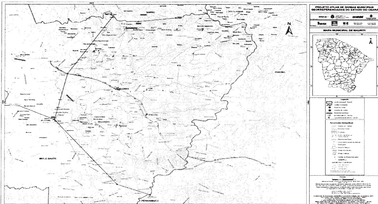
Mapa municipal de Mauriti, parte integrante desta Lei.