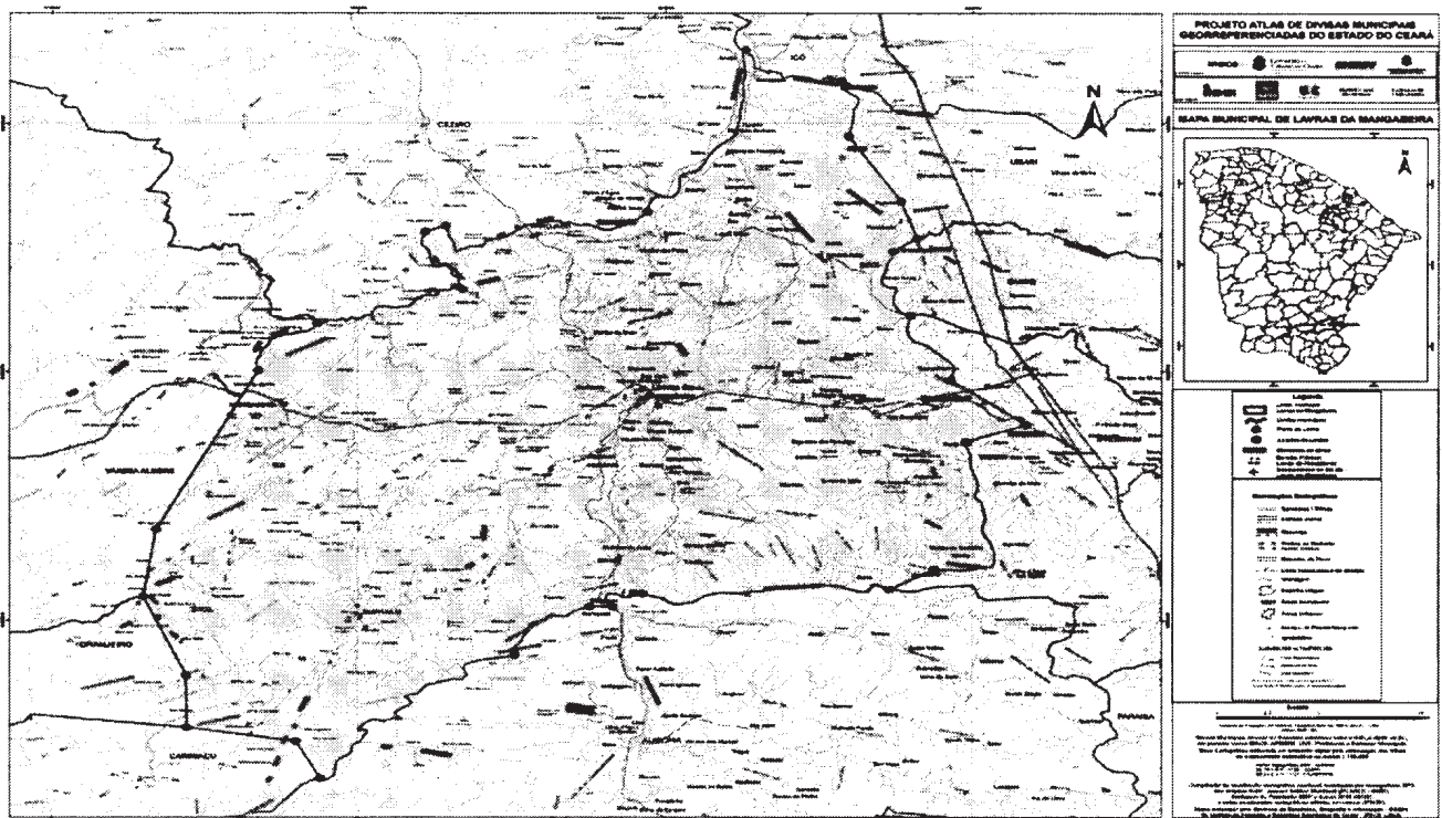
Mapa municipal de Lavras da Mangabeira, parte integrante desta Lei.

Com o município de VÁRZEA ALEGRE - A oeste. Começa na foz do Riacho dos Patos no Riacho do Boqueirão [479.514/9.241.448]; segue em linha reta até o pico da Serra da Mescla [480.131/9.245.546]; vai por outra linha reta até a nascente do Riacho Mudubim, na Serra do Mudubim [485.123/9.255.079] e desce por este riacho até sua foz no Riacho do Machado [488.012/9.257.933].