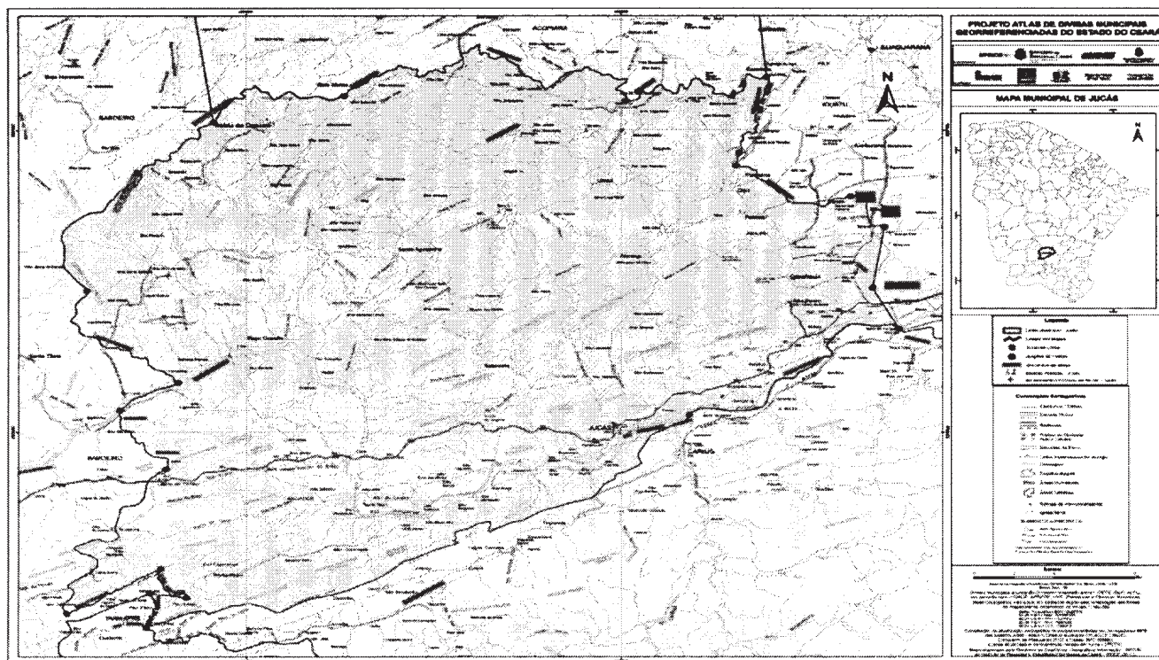
Mapa municipal de Jucás, parte integrante desta Lei.

Com o município de SABOIRO - A oeste. Começa na nascente do Riacho Malcozido [418.596/9.269.100], no divisor de águas entre o Rio dos Bastiões e o Rio Jaguaribe, segue em linha reta até a nascente do Riacho Pau d'Arco [420.421/9.268.827]; desce por este riacho até a sua foz no Riacho da Seda [419.145/9.270.635]; sobe pelo Riacho da Seda até a sua nascente [414.447/9.267.841]; toma o divisor de águas entre os afluentes do Rio Jaguaribe que deságuam a montante e os que deságuam a jusante da foz do riacho que mangleia a localidade Bonsucesso até a nascente deste riacho [419.405/9.276.729]; desce por este riacho até a sua foz, no Rio Jaguaribe [417.085/9.280.354]; desce por este rio até a foz do Riacho São Joaquim [420.008/9.282.065]; sobe por este riacho até sua nascente, na Serra da Estrela [415.443/9.287.777] e segue pelo divisor de águas desta serra e da Serra do Mota até o pico da Serra Pedra de Travessa [421.783/9.298.096], na parte oriental da Serra do Mota.