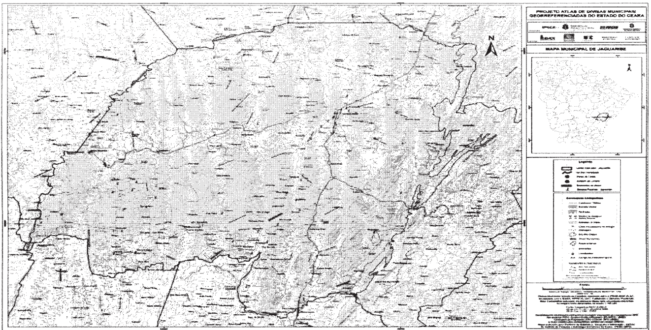
Mapa municipal de Jaguaribe, parte integrante desta Lei.