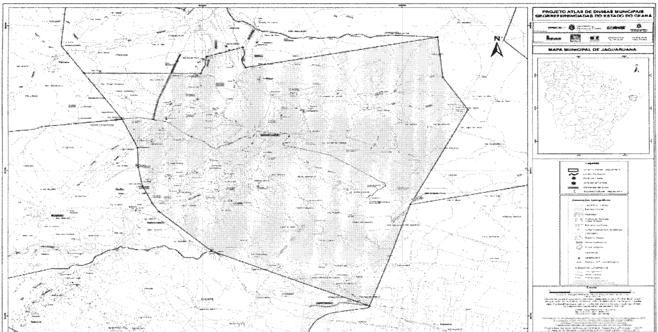
Mapa municipal de Jaguaruana, parte integrante desta Lei.