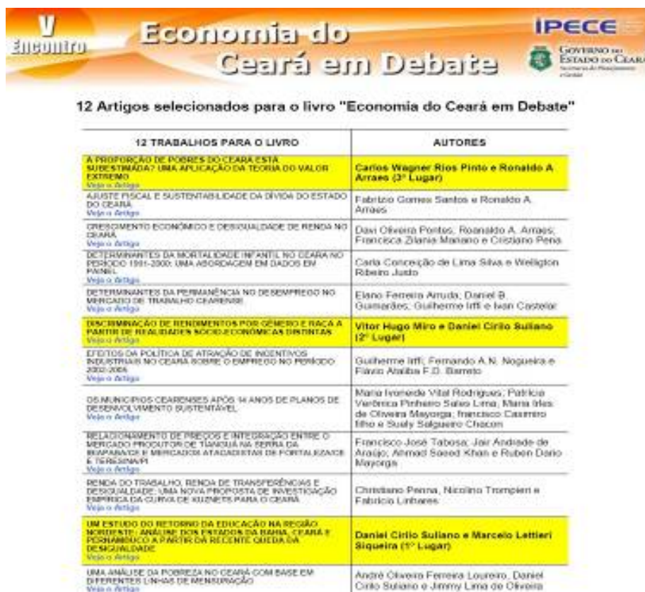
Figura 8 - V Encontro de Economia do Ceará em Debate

Em suma, neste Resultado Estratégico, foram previstos 60 produtos e produzidos um total de 72, sendo: