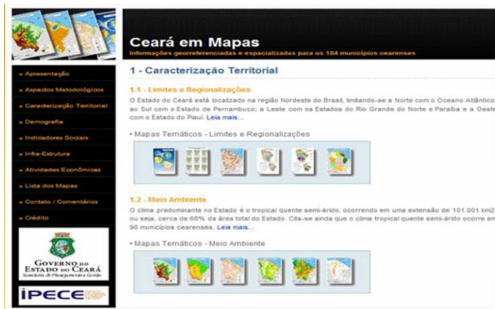
Figura 3 - Ceará em Mapas