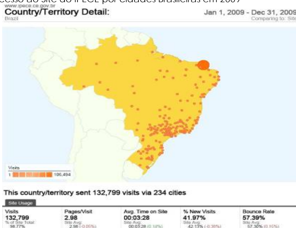
Mapa 2 - Acesso ao Site do IPECE por cidades Brasileiras em 2009

No mapa 2 podem ser visualizadas as origens das visitas no Brasil e o total dos acessos, referente ao ano de 2009.