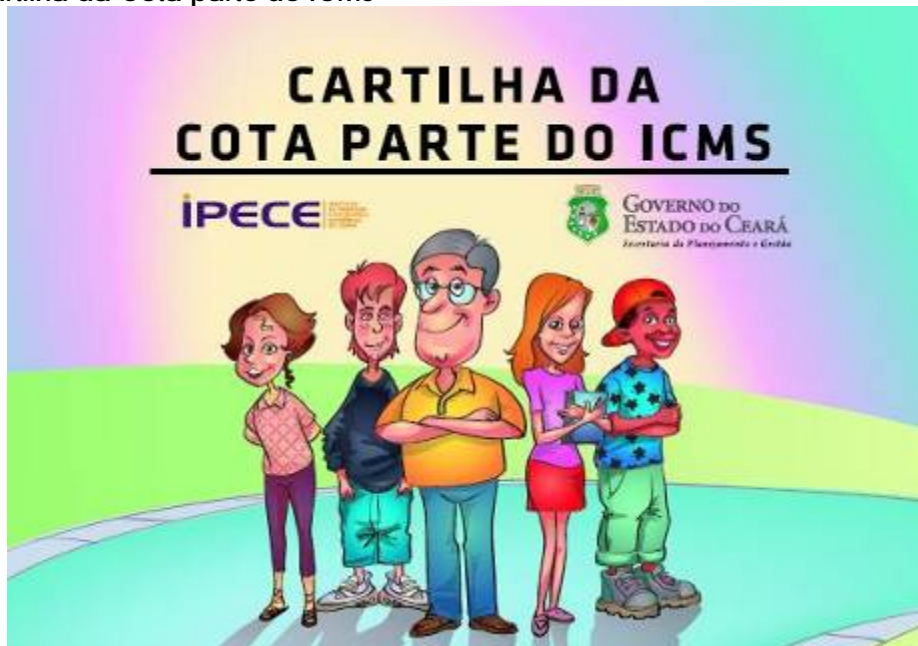
Figura 10 - Cartilha da Cota parte do ICMS

Por último, percebeu-se a necessidade de facilitar o conhecimento por parte do público alvo do IPECE acerca do acervo de produtos do IPECE e com esse objetivo foi elaborado o catálogo das publicações, ilustrada na Figura 11, com a descrição dos estudos e periódicos do IPECE também publicado e disponibilizado no site.