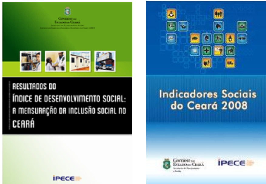
Figura 5 - Indicadores Sociais do Ceará e Índice de Desenvolvimento Social (IDS)

Além disto, o Instituto recebeu 3 demandas novas de estudos, que foram elaboradas e estão listadas a seguir: