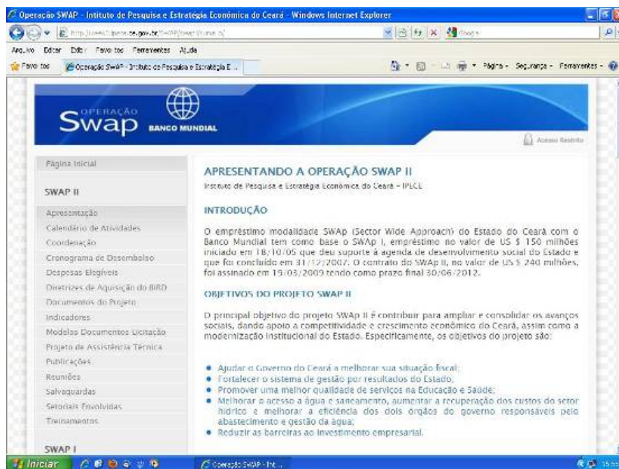
Figura 6 - Operação SWAp II no site do IPECE

Os produtos gerados, então, foram as atas destas reuniões, em formato de relatório que contém a posição dos indicadores primários, secundários, programas elegíveis e projetos de assistência técnica sendo disponibilizadas no site do IPECE 7 , conforme indicado na Figura 6 e o Relatório Anual de Desempenho 2009 que é demonstrado na Figura 7.