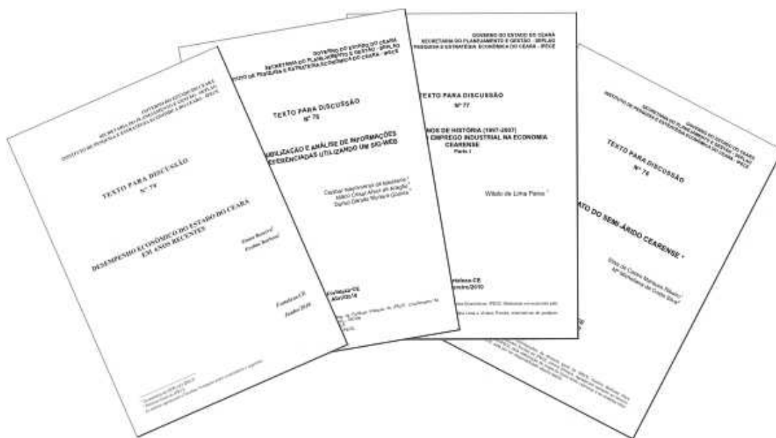
Figura 9: Texto para Discussão (TD) e Nota Técnica (NT)

No Resultado Estratégico 4, o número de projetos previstos foram ultrapassados em 57% e o número de produtos em 43%. Foram previstos 19 projetos e realizados 29, essa diferença de 10 refere-se ao acréscimo de 15 novos estudos e a não realização de 5 previstos. Esses estudos foram elaborados e publicados como Texto para Discussão (TD) ou Nota Técnica (NT) 9 conforme estão ilustrados na Figura 9 e listados a seguir: