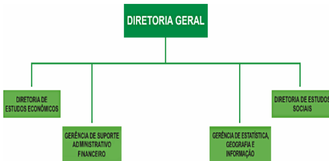
Figura 1 - Organograma IPECE - 2009