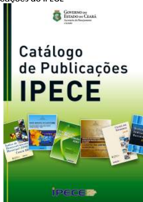
Figura 11 - Catálogo das Publicações do IPECE

Por último, percebeu-se a necessidade de facilitar o conhecimento por parte do público alvo do IPECE acerca do acervo de produtos do IPECE e com esse objetivo foi elaborado o catálogo das publicações, ilustrada na Figura 11, com a descrição dos estudos e periódicos do IPECE também publicado e disponibilizado no site.