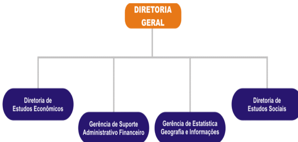
Figura 1- Organograma IPECE - 2008

de Estatística, Geografia e Informação. Todas elas estão subordinadas ao Diretor – Geral, conforme a Figura 1.