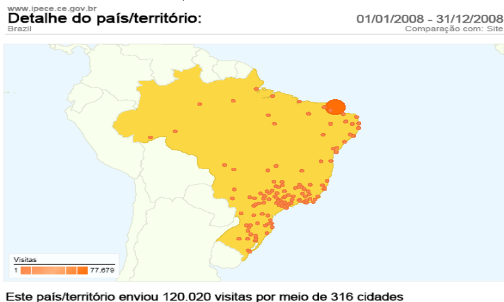
Mapa 2: Acesso ao Site do IPECE por Cidades Brasileiras em 2008