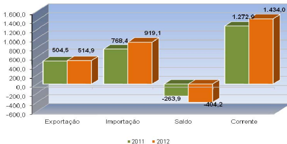
Gráfico 01: Balança Comercial Cearense Jan - Maio 2011/2012 (US$ FOB)